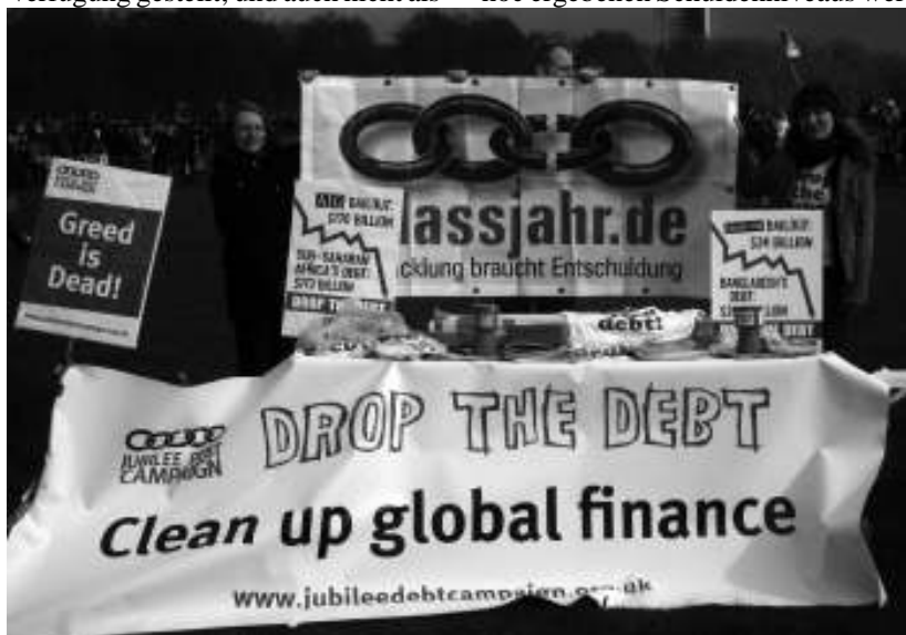
Jubilee Debt Campaign und erlassjahr.de in London

• Schließlich verweist SÜDWIND in einer Erklärung zum Gipfel darauf, dass (wieder einmal) die Internationalen Finanzinstitutionen – trotz ihrer mehr als fragwürdigen Reputation als Krisenmanager – gestärkt aus dem Gipfel hervorgehen. Die Ausweitung von Mitteln und Instrumenten, insbesondere beim IWF, bedeutet eine enorme Aufwertung einer Institution, deren schiere Daseinsberechtigung noch vor einem Jahr sehr kontrovers diskutiert wurde. Wie schon bei der Multilateral Debt Relief Initiative (MDRI) 2005 haben Weltbank und IWF es geschafft, zuallererst ihre eigenen institutionellen Interessen abzusichern.