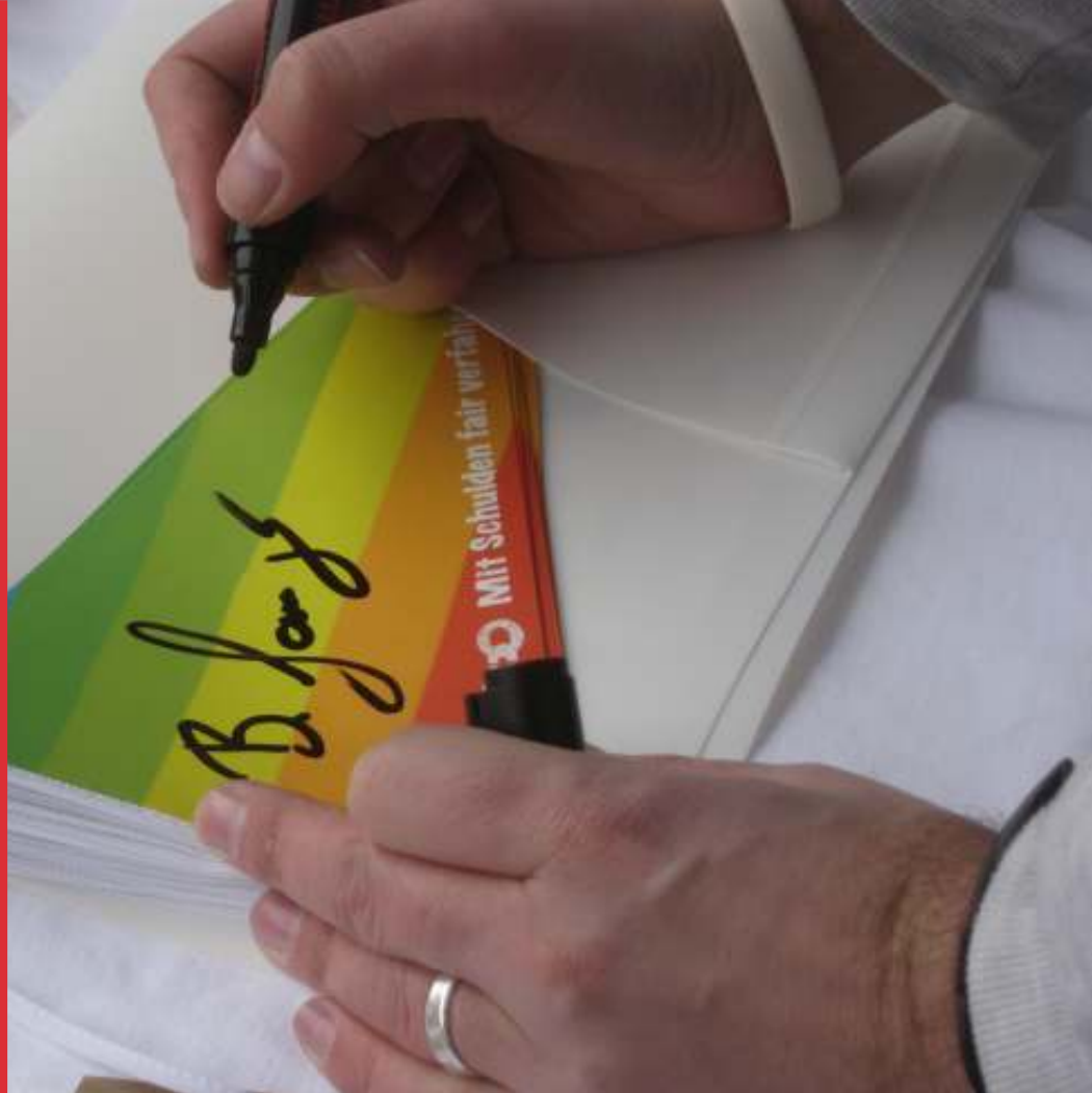
Unterschrift auf einem der erlassjahr.de Wimpel