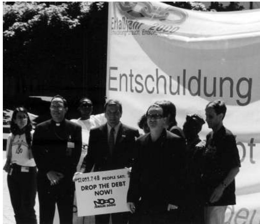
Übergabe der Erlassjahr2000-Unterschriften an den damaligen Bundeskanzler Gerhard Schröder am 19.6.1999

Ebenso wie zu dieser spannenden Podiumsdiskussion sind alle erlassjahr-Aktiven herzlich eingeladen zum "Kirchenforum", welches im Anschluss an die Podiumsdiskussion stattfindet. Zusammen mit Bischöfen aus Deutschland und der weltweiten Ökumene, mit Basischrist/innen aus den erlassjahr-Mitträgergemeinden und -gruppen wollen wir einen kritischen Blick auf die Arbeit des Bündnisses seit den Zeiten des Kölner Gipfels werfen. Als besondere Highlights haben wir auch Menschen eingeladen, die in dieser Zeit unser Gegen-