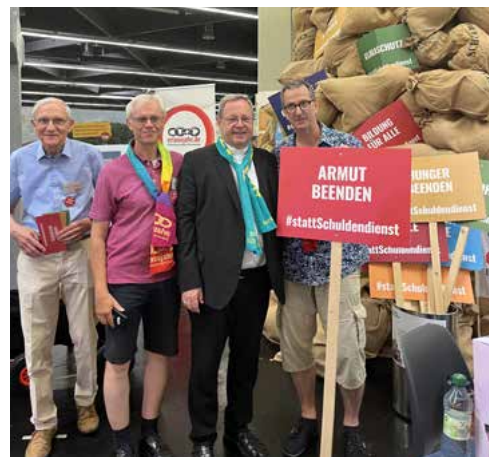
Dr. Georg Bätzing, Bischof von Limburg und Vorsitzender der deutschen Bischofskonferenz, mit Aktiven von erlassjahr.de vor dem Schuldenberg.