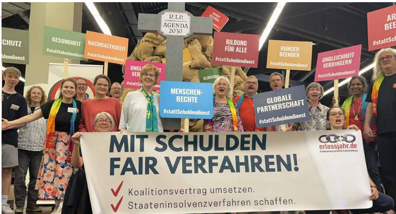
Aktivist*innen vor dem Schuldenberg am Stand von erlassjahr.de beim Kirchentag in Nürnberg.