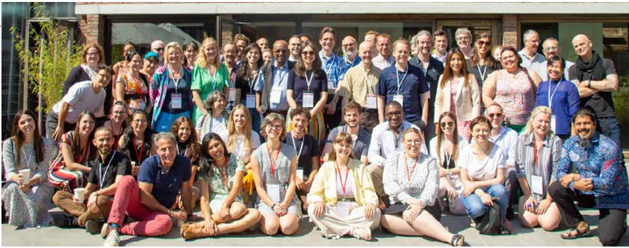
Teilnehmer*innen des Netzwerktreffens von Eurodad im Juni 2023.