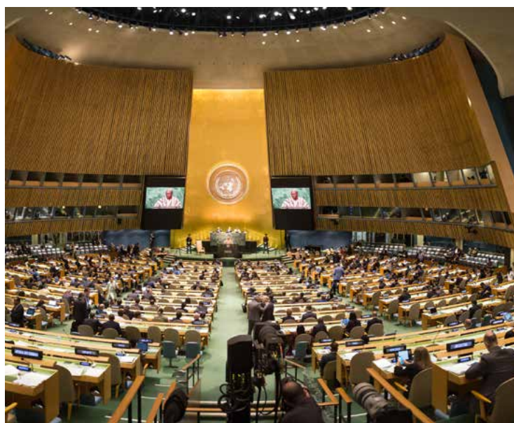
2014 gab es Hoffnung für ein Staateninsolvenzverfahren bei den Vereinten Nationen. Doch obwohl die Mehrheit der Staaten der Resolution zustimmte, blieb auch dieser Vorstoß ohne Ergebnis.

Seit den 1980er Jahren erarbeiteten auch vermehrt Vertreter*innen aus Wissenschaft und Zivilgesellschaft Vorschläge und brachten diese in die Debatte ein. Internationale Konferenzen, wie etwa die globale Entwicklungsfinanzierungskonferenz 2003 in Monterrey, oder Expert*innenkommissionen, wie die „Stiglitz-Kommission“ zur globalen Finanzkrise 2009, bekräftigten immer wieder die Notwendigkeit eines Staateninsolvenzverfahrens.