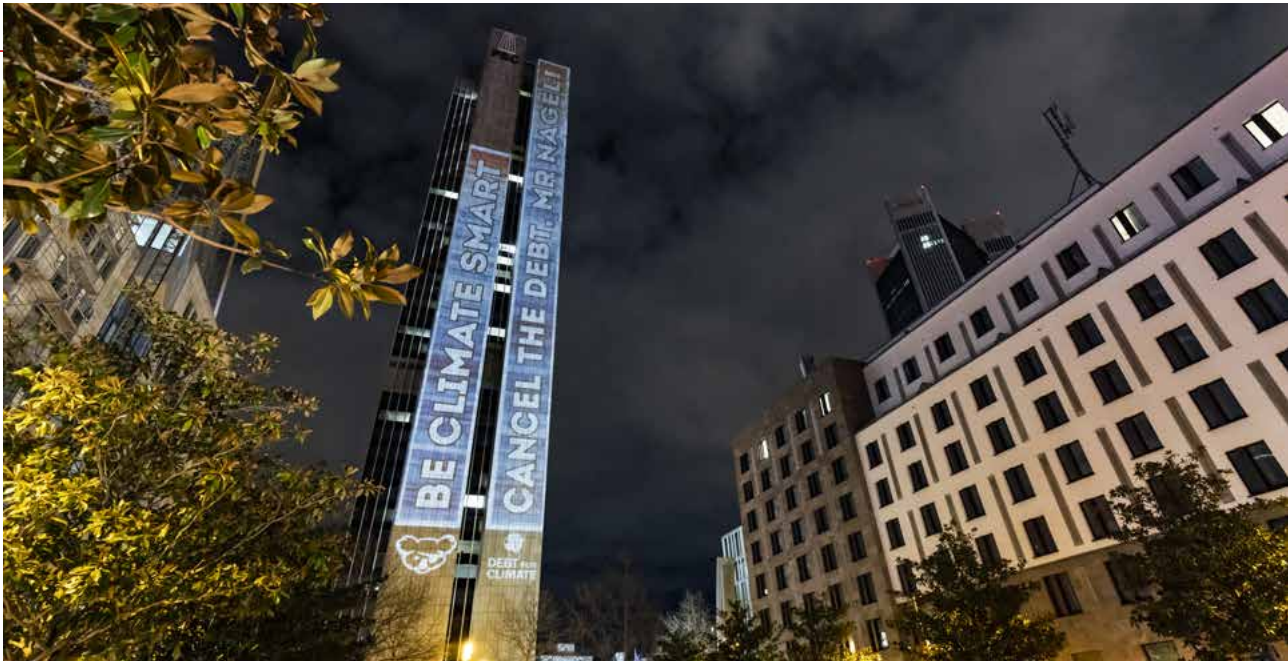
Aktion des Frankfurter „KoalaKollektivs“ zum Jubiläum des Londoner Schuldenabkommen.