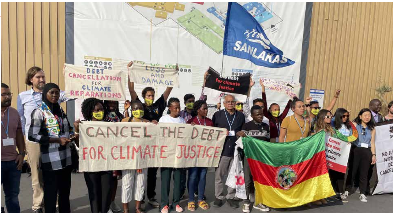
Bei der 27. UN-Klimakonferenz fordern Aktivist*innen Schuldenstreichungen im Namen der Klimagerechtigkeit.