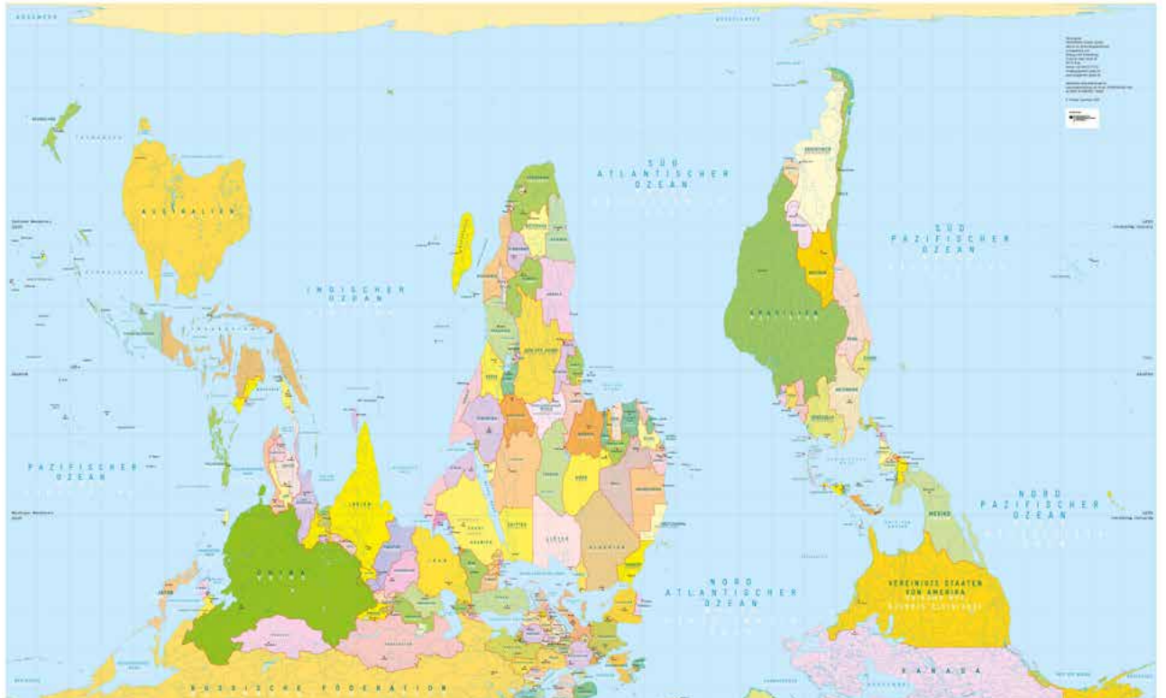
Unsere Perspektive bestimmt, wie wir die Welt sehen. | „Bildung trifft Entwicklung / Engagement Global gGmbH © MAPS IN MINUTESTM 2020“